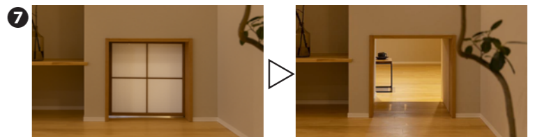
部屋のアクセントにもなっている主寝室とLDK間を行き来できるペット専用出入口(犬1匹、猫1匹)