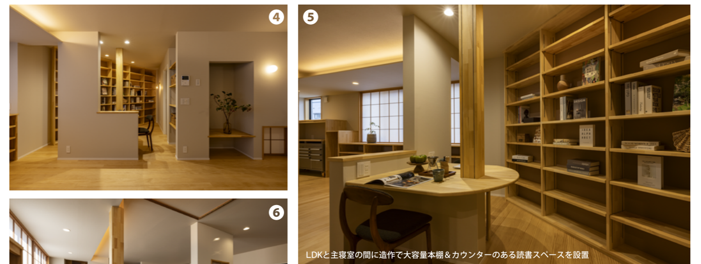
LDKと主寝室の間に造作で大容量本棚&カウンターのある読書スペースを設置